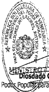
Diosdado Cabello Rondón

Comuníquese y publíquese. Por el Ejecutivo Nacional.