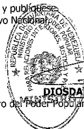
Diosdado Cabello Rondón

Comuníquese y publíquese. Por el Ejecutivo Nacional.